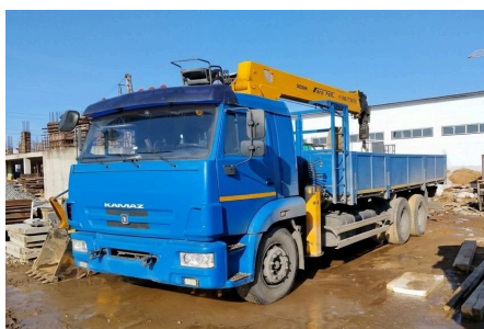
Манипулятор SOOSAN 7т