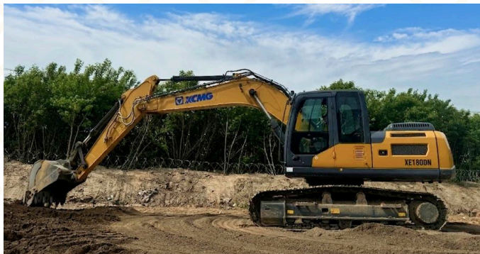
Гусеничный экскаватор XCMG XE180DN