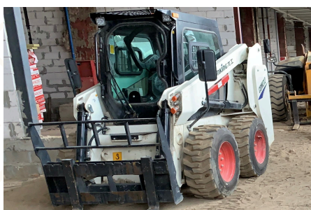
Погрузчик малогабаритный LONKING CDM312