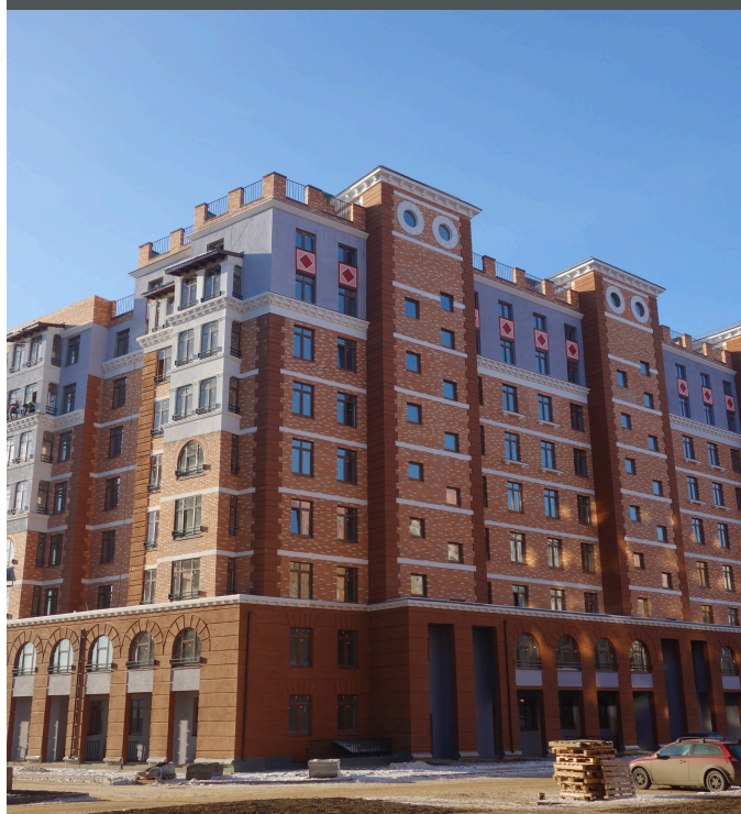
ЖК «Пятницкие кварталы»