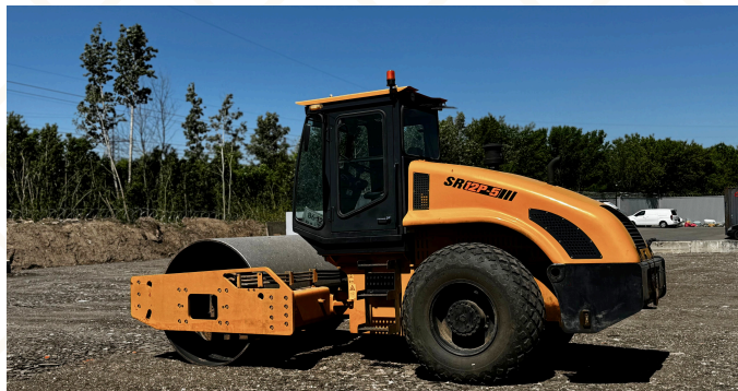
Грунтовый каток SR12P-5