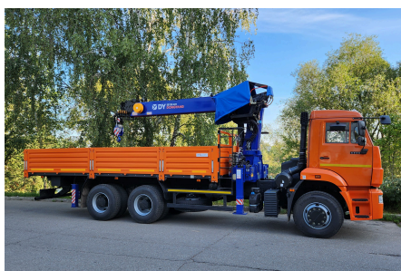
Манипулятор DONGYANG 8т