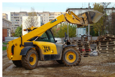
Телескопический погрузчик JCB 531-70