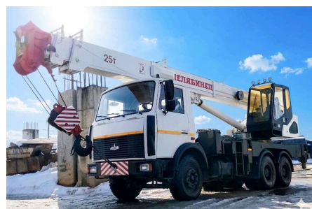
Автомобильный кран 25т